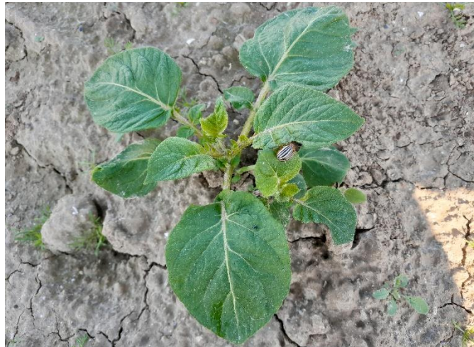
Doryphore sur pomme de terre levée, secteur Calvados

La présence de doryphore adulte a été signalée sur des pommes de terre du Calvados ainsi que sur un tas de déchets dans le secteur d'Yvetot.