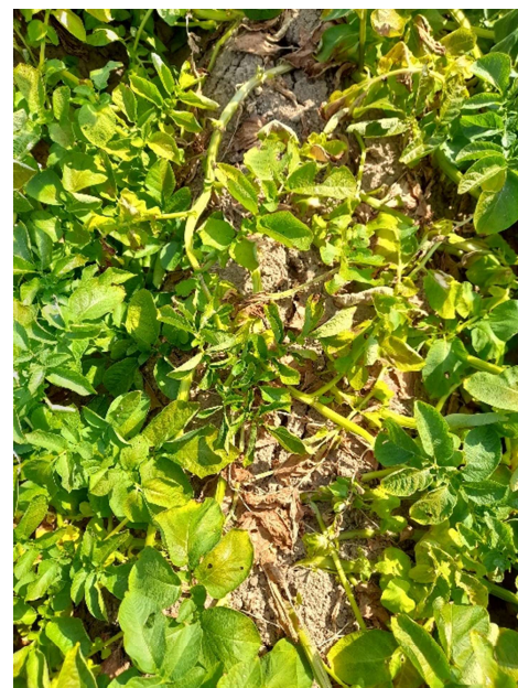
Crevasse sur une butte liée au manque d'eau et feuillage sénescent (Chambre d'Agriculture de Normandie)