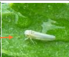
Cicadelle sur chrysanthème

En extérieur, des cicadelles (adultes et larves) et quelques traces de piqûre de nutrition ont été observées sur culture de chrysanthème .