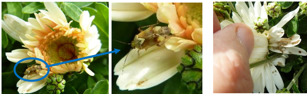
Adulte et dégât de punaise Lygus spp sur chrysanthème

Evolution à suivre : surveiller l'évolution des populations, certaines punaises Lygus spp occasionnent des avortements de boutons, des déformations de fleurs et de pétales et déprécient la valeur des plantes par leurs piqûres de nutrition sur les fleurs.