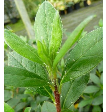
Pucerons verts sur jeunes pousses d'azalée mollis

Des auxiliaires sont toujours présents dans les foyers : adultes de coccinelle, punaises prédatrices et carabes.