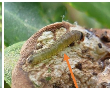
Dégât et chenille de la tordeuse du houx