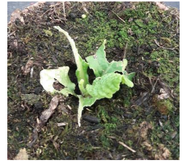
Dégât sur primevère

Observez vos cultures au cœur des plants afin de repérer la présence de chenilles notamment par leurs excréments ou par les feuilles mangées.