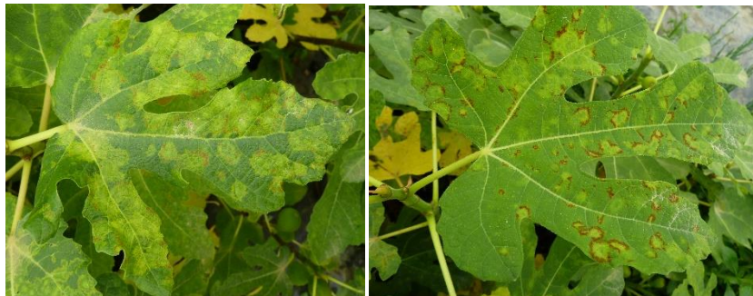
Maladie de la mosaïque du figuier

Le virus de la mosaïque du figuier est généralement transmis par l'acarien du figuier, Aceria ficus .