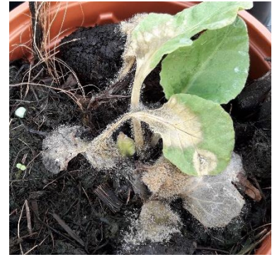
Dégât de Botrytis

Les fructifications sur les végétaux contaminés (spores à la surface des feuilles sous forme de poussière grise caractéristique) vont être à l'origine de contaminations secondaires sur d'autres plants.