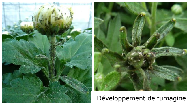
Pucerons sur fleurs et tiges

En extérieur, des pucerons sont également présents sur des cultures de chrysanthème en grappe sur les tiges. Des auxiliaires sont présents dans certains foyers : adultes de coccinelle.