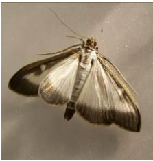
Piège et adulte de Pyrale du buis

Suivi des relevés des pièges mis en place en semaine 20 chez 8 producteurs du réseau normand :