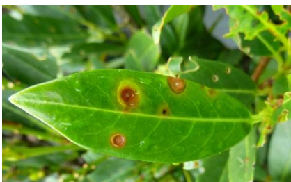
Maladie criblée sur laurier du Portugal