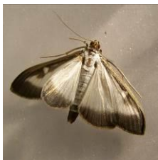
Piège et adulte de Pyrale du buis

Suivi des relevés des pièges mis en place en semaine 20 chez 8 producteurs du réseau normand.