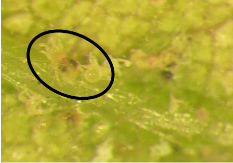
Adulte et œuf de tétranyque