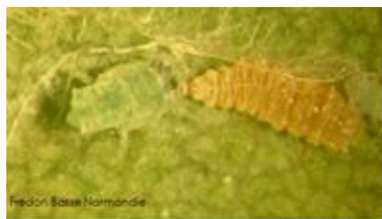
Fredon Basse Normandie

https://ecophytopic.fr/pic/proteger/aphidoletes-aphidimyza-en-cultures-ornementales