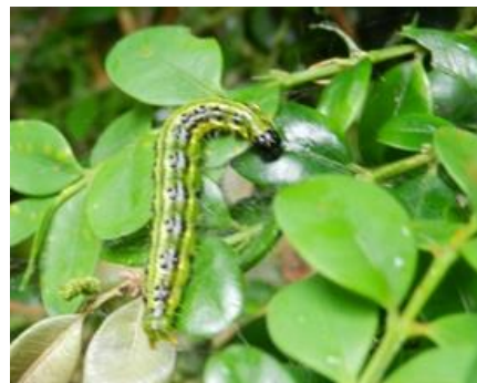
Chenille de Pyrale du buis