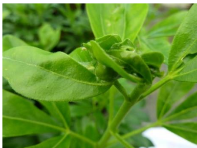
Symptôme et chenille sur Choisya ternata

Sous abris, des tordeuses (chenilles) sont toujours observées sur diverses cultures : Choisya ternata et Pittosporum tobira . Les chenilles consomment les feuilles et tissent une toile entre les feuilles des jeunes pousses pour se nymphoser et bloquent alors la croissance de la pousse.