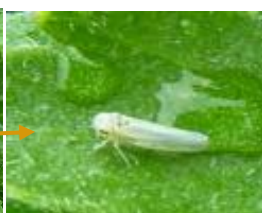
Cicadelle sur chrysanthème

Sous abris, quelques cicadelles ont été observées sur culture de chrysanthème et de primevère sans faire de dégâts.