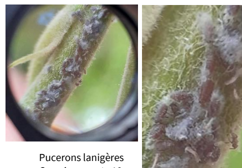
Pucerons lanigères Grossissement x10

Quelques foyers de pucerons lanigères ( Eriosoma lanigerum ) ont de nouveau été observés sur des pommiers hautes tiges.