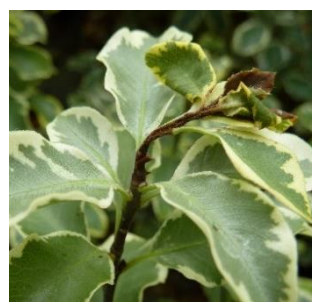
Dégât de chenille sur Pittosporum