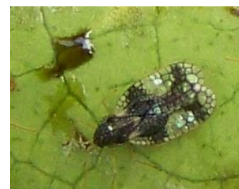
Adulte et excréments au revers d'une feuille

Evolution à suivre : à surveiller, on compte plusieurs générations par an. Observez attentivement le revers des anciennes feuilles et plus particulièrement sur les feuilles présentant des piqûres de nutrition même si ce sont d'anciens dégâts.