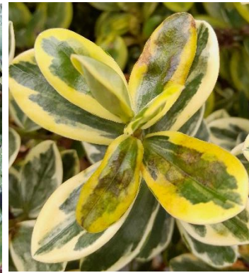
Dégâts de mildiou.