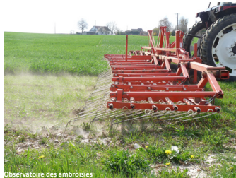
Observatoire des ambrosies

Efficace aux stades fil blanc, cotylédons et 2 feuilles