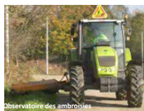
Observatoire des ambrosies

En bord de route ou de parcelles, la fauche contribue à la gestion des ambrosies.