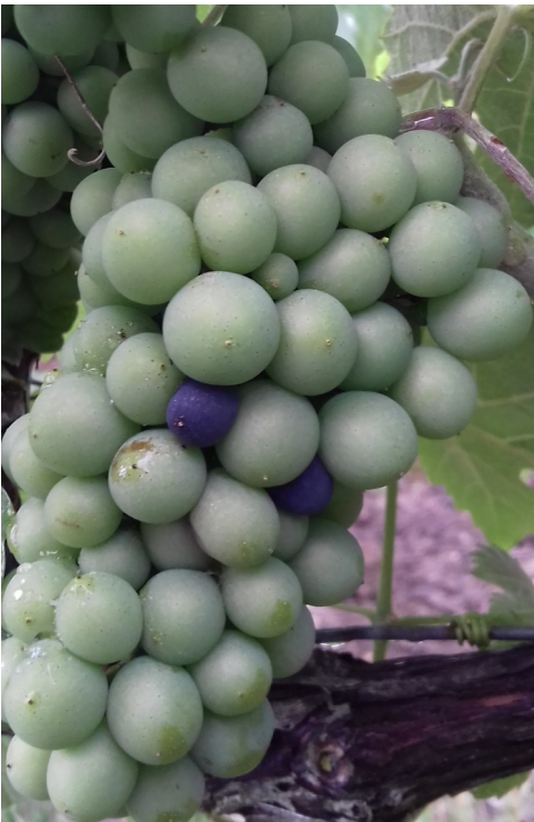
Quelques baies vérées.

Des baies colorées sont maintenant régulièrement signalées au vignoble. Ce phénomène va s'amplifier dans les jours à venir. Quelques parcelles précoces ont atteint le stade « début véraison » (une grappe sur deux avec au moins une baie vérée).