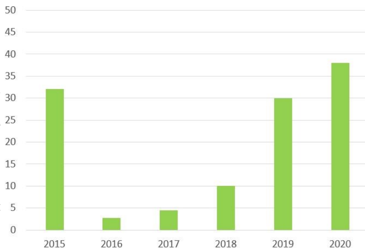
Fréquence de parcelles avec oïdium sur grappes au stade fin fermeture de la grappe

Au final, l'année 2020 se classe parmi les années à pression oïdium moyenne à élevée, comme 2015 et 2019.