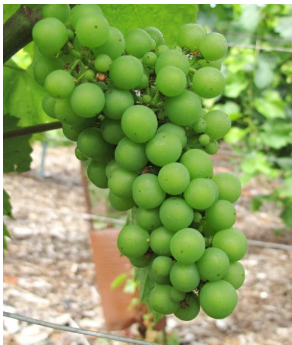
Les grappes se ferment.

Les baies continuent de grossir, et les grappes se ferment progressivement.