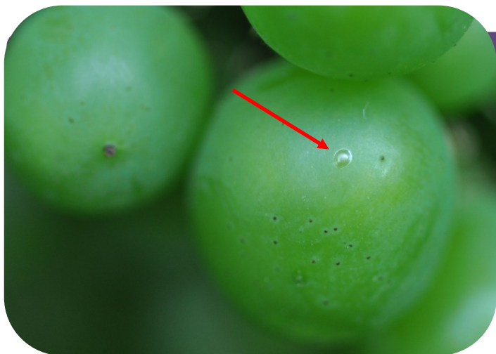
Œuf d'eudémis (irisé)

En secteurs non confusés, le risque G2 est maintenant présent et à prendre en compte dès le milieu de cette semaine.