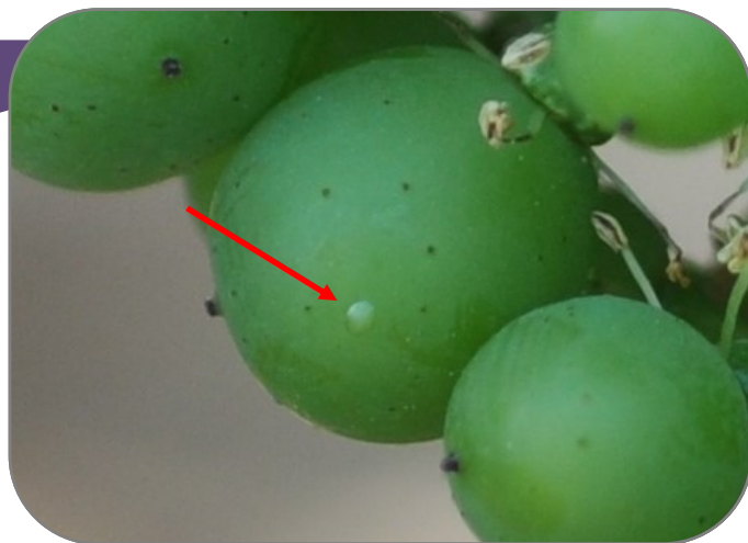
Œuf de cochylis (nacré)