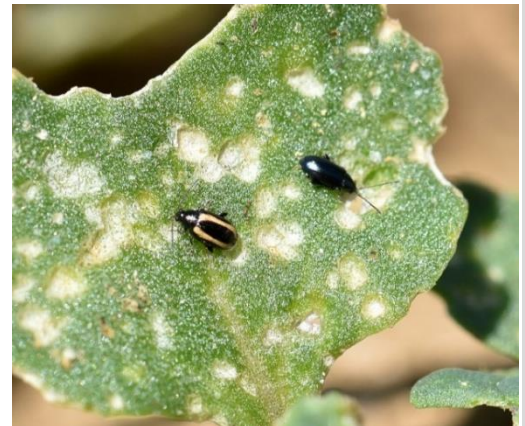
Dégâts de petites altises. Terres Inovia.

Les interventions inutiles favorisent l'apparition de résistances et potentiellement les pullulations de pucerons en l'absence de faune auxiliaire.