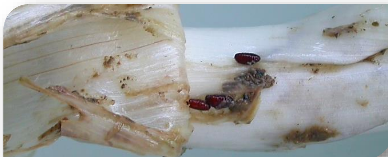
Photo : observation de galeries et de pupes.