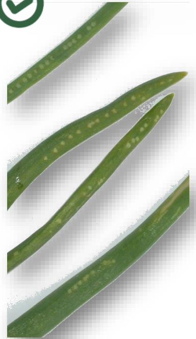
Photo : piqure de nutrition : points blancs alignés sur feuille de ciboulette