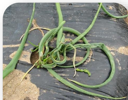
Photo : déformation d'un oignon suite aux dégâts des larves.