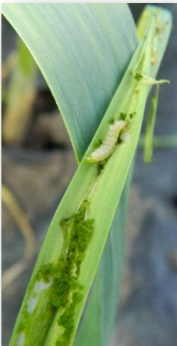
Photo : dégâts de teigne du poireau : la larve fore des galeries dans le poireau.