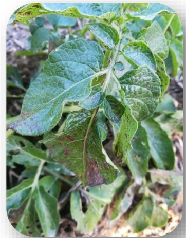
Photo : P. Loquais - Jardinier. Petites taches brunes suite aux averses orageuses.

Sur certaines parcelles, on peut observer de nombreuses petites taches brunes sur le feuillage. Ces taches sont dues aux précipitations parfois fortes qui impactent le feuillage. Si l'humidité persiste, des champignons peuvent ensuite se développer sur ces feuilles abîmées.