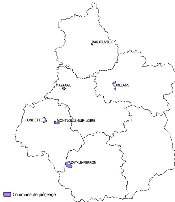
Réseau de surveillance et de piégeage de la pyrale du buis en région Centre Val de Loire - année 2020-

Grâce à leur comptage hebdomadaire, nous sommes en mesure de vous proposer un suivi de la période de vol de ce papillon . Ce suivi vous permettra de bien cibler vos interventions vis-à-vis de ce ravageur et de protéger vos buis.