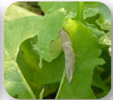
Dégâts de limaces sur haricots verts.