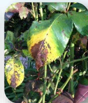
Taches sur feuillage