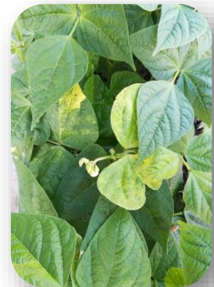
Chimère sur 1 pied de haricot vert

Sur certains végétaux, il n'est pas rare d'observer des décolorations jaunes plus ou moins nettes qui parfois adoptent des formes plus ou moins curieuses. Il s'agit en fait d'anomalie génétique appelée chimère. C'est une maladie d'origine physiologique qui n'affecte pas les autres végétaux.