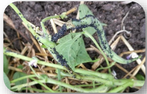
Photo: JC Ferail - Jardinier. Colonies de pucerons noirs sur haricots verts

Sur plusieurs jardins, des colonies de pucerons noirs sont observés sur les jeunes pousses d'haricots verts.