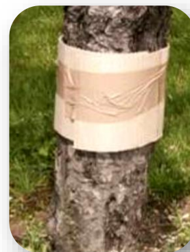
Bande piège cartonnée pour piégeage de chenilles de carpocapses

Informations complémentaires et tuto vidéo sur https://www.jardiner-autrement.fr/lutter-contre-le-carpocapse-a-laide-du-biocontrôle