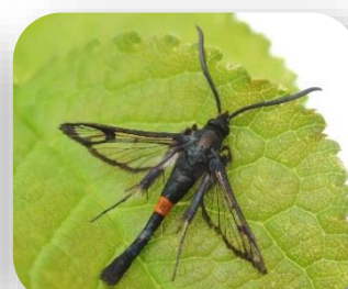
J. Chabault Sésie adulte

Sa chenille, s'installe dans les aspérités du bois, souvent au niveau des bourrelets de greffe, dans les broussins ou dans les chancres. Elle creuse des galeries entre écorce et aubier, favorisant le développement de chancre à nectria. Elle évolue sur 2 années dans le bois (cycle sur 3 années calendaires). En fin de développement, elle mesure 20 à 25 mm.