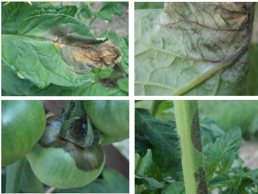
divers symptômes du mildiou sur feuilles, tiges et fruits