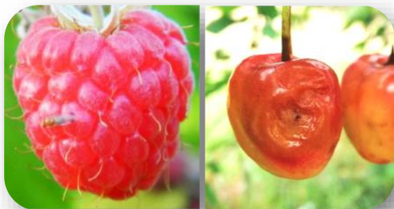
D. suzukii mâle sur framboise / Pourriture due aux larves sur cerise