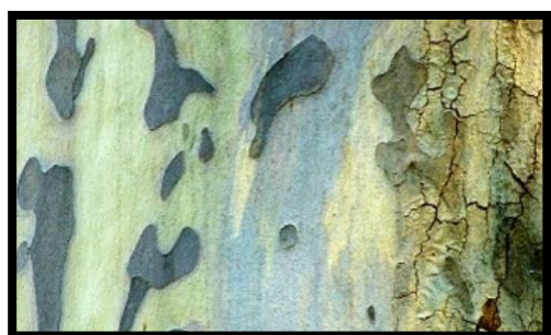
Taches brunes à violacées