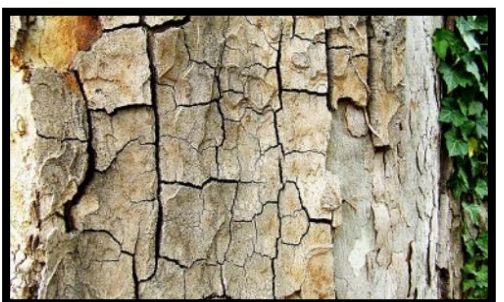
Gonflements de l'écorce