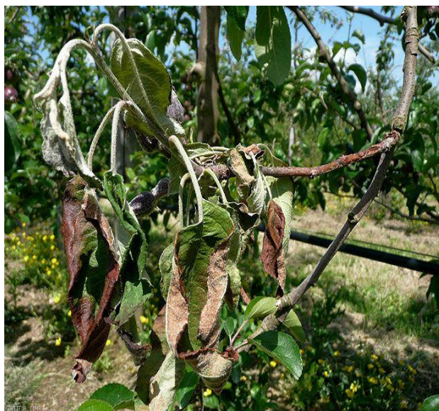
Noircissement de feuilles et pousses recourbée en crosse sur pommier

Cette maladie bactérienne, très contagieuse, s'attaque aux fruitiers à pépins mais aussi aux aubépines, cotoneasters et pyracanthas. Un des symptômes de cette maladie est le noircissement des feuilles et le dessèchement de l'extrémité des pousses qui se recourbent en crosse.