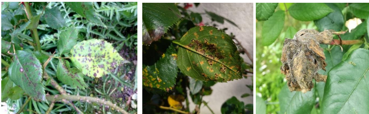
de gauche à droite : maladie des taches noires, la rouille et la pourriture grise sur fruit