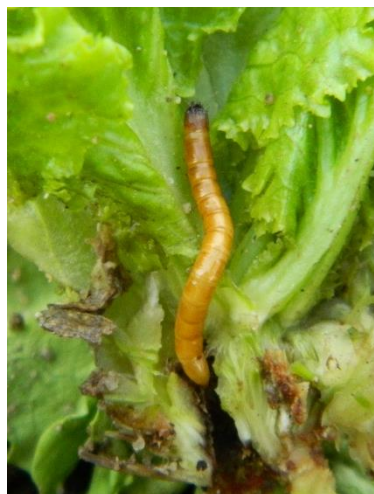
A gauche, une salade flétrie... A droite, en décortiquant la salade, on retrouve le taupin dans le collet !