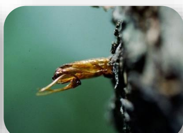
CTIFL Dépouille nymphale