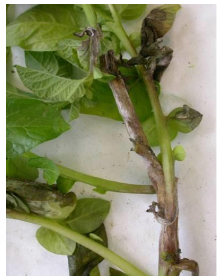
Eléments de reconnaissances du mildiou de la pomme de terre