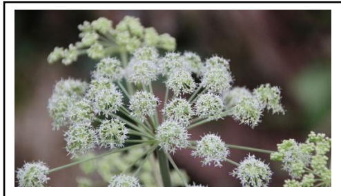
Photo d'une Angélique vraie

Pas moins de 58 plantes susceptibles de porter atteinte à la santé publique y ont été incluses. Parmi elles, le Datura stramoine, le Laurier rose, l'Aconit, etc ; reconnue pour leur toxicité à l'ingestion ; l'Angélique vraie, la Berce du Caucase, le Dieffenbachia ou les Euphorbes pour leur toxicité par contact cutané ou encore les Armoises, le Noisetier commun ou le Cyprès commun pour les allergies respiratoire qu'ils peuvent provoquer.