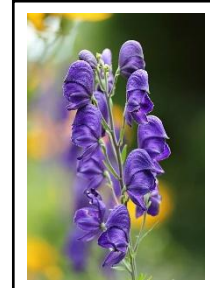
Photo d'un Aconit