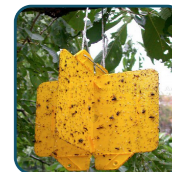
Piège Rebell® Jaune