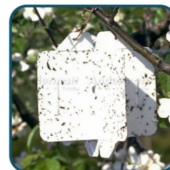
Piège Rebell® Blanc

Comportant 2 panneaux jaunes, englués sur les 2 faces, à entrecroiser. Disponible à l'unité.