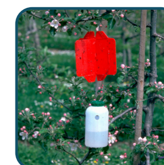
Flacon + piège Rebell® Rouge, vendus séparément