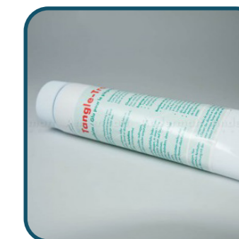
Tangle-Trap Glue Tube

Glue pour ré-engluer les pièges chromatiques Rebell® ou pour créer une barrière physique contre les fourmis.