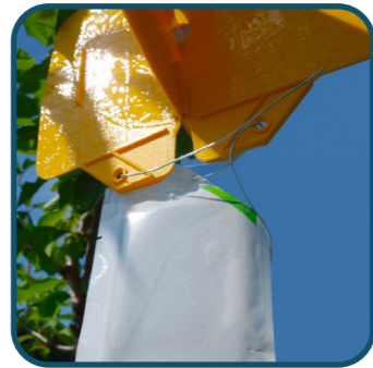
Kit piège mouche cerise