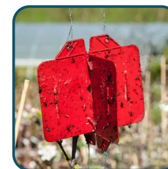
Piège Rebell® Rouge