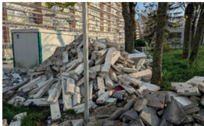
Stockage de déchets de béton en pied d'arbre

Les travaux réalisés à proximité d'arbres sont des sources de blessures potentielles pour ces derniers. On pense souvent aux blessures des parties aériennes (tronc, branches) que l'on protège assez souvent, mais on pense beaucoup moins facilement aux blessures occasionnées en souterrain. Or ce sont des blessures qui, elles aussi, peuvent entraîner des dégâts, voir même la mort de l'arbre, notamment avec l'asphyxie du système racinaire, par tassement du sol.