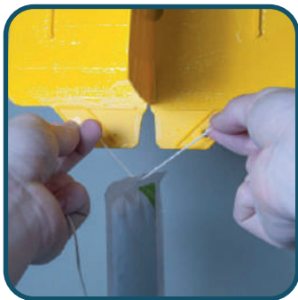
Kit piège mouche cerise