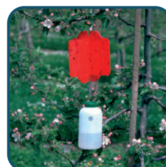
Flacon + piège Rebell® Rouge, vendus séparément