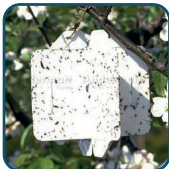
Piège Rebell® Blanc