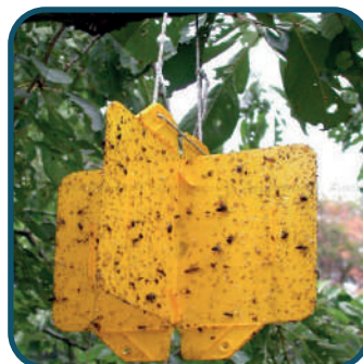
Piège Rebell® Jaune