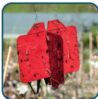
Piège Rebell® Rouge