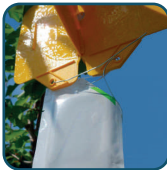
Kit piège mouche cerise