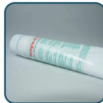
Tangle-Trap Glue Tube

Glue pour ré-engluer les pièges chromatiques Rebell® ou pour créer une barrière physique contre les fourmis.