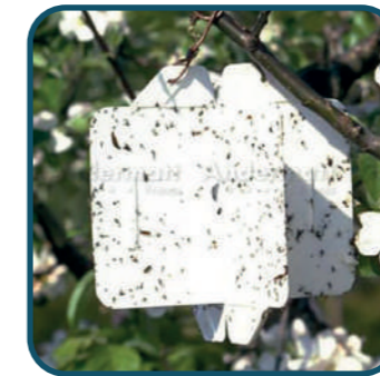
Piège Rebell® Blanc