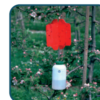
Flacon + piège Rebell® Rouge, vendus séparément