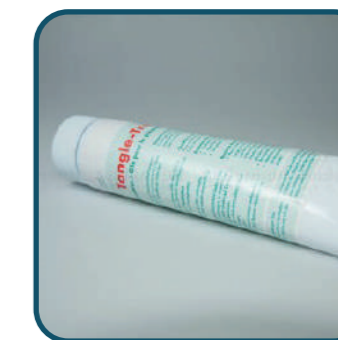
Tangle-Trap Glue Tube

Glue pour ré-engluer les pièges chromatiques Rebell® ou pour créer une barrière physique contre les fourmis.