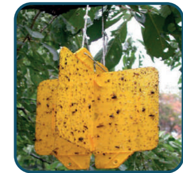
Piège Rebell® Jaune