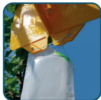
Kit piège mouche cerise