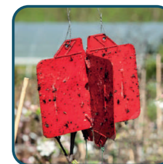
Piège Rebell® Rouge