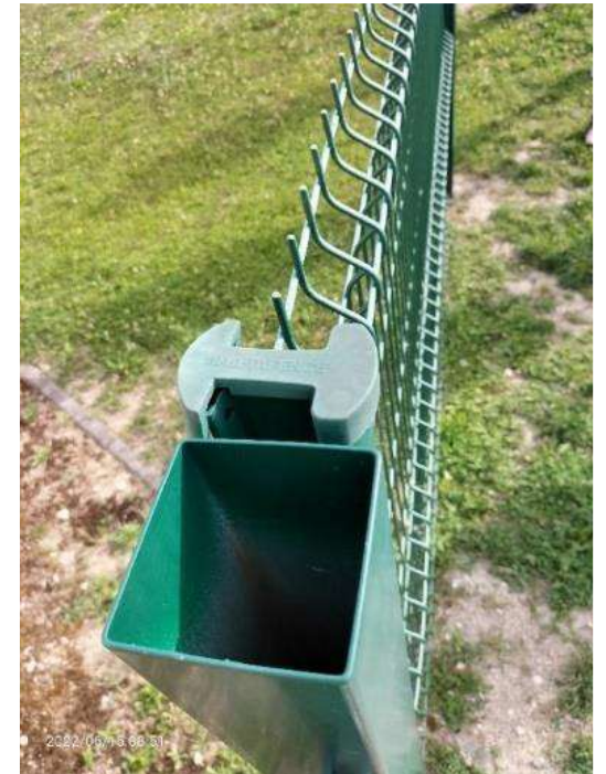
Exemple de piège à faune involontaire